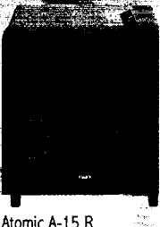
Atomic A-15 R