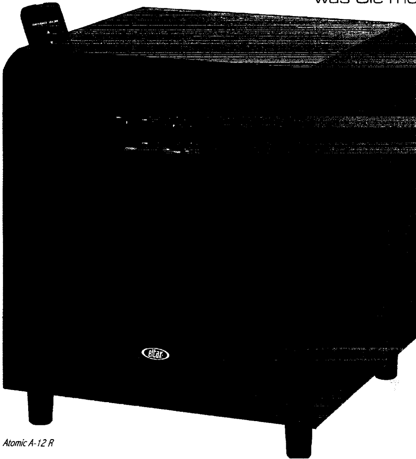
Atomic A-12 R

ersten Mal richtig erleben«. Der aktive Atomic Subwoofer macht es möglich, selbst den tiefsten Bass und alle tiefen Frequenzen zu hören, sei es beim Sehen eines Filmes, bei sportlichen Ereignissen oder Konzerten.