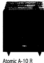
Atomic A-10 R